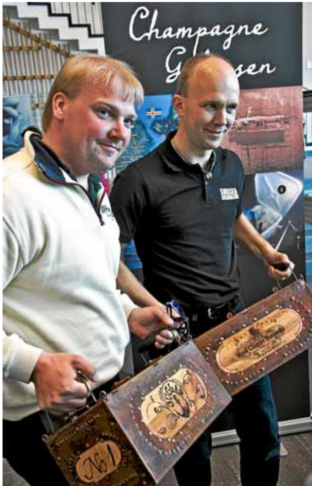
Dos submarinistas con las botellas rescatadas.

El líquido, eso sí, no ha llegado virgen a la puja. "Tenía un sabor muy dulce, sabía a roble y olía a tabaco", ha con-