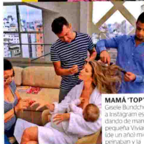
MAMÁ 'TOP' Gisele Bündchen subió a Instagram esta foto dando de mamar a su pequeña Vivian Lake (de un año) mientras la peinaban y la maquillaban para una sesión de trabajo.