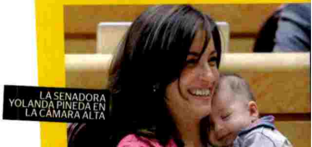
LA SENADORA YOLANDA PINEDA EN LA CAMARA ALTA

Las mujeres en puestos de liderazgo han dado visibilidad a la maternidad en el trabajo.