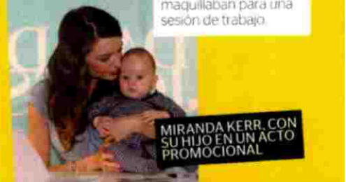
MIRANDA KERR, CON SU HIJO EN UN ACTO PROMOCIONAL