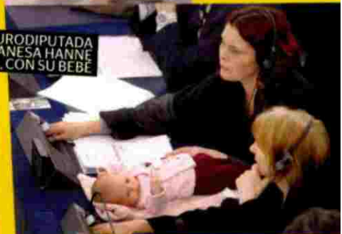
LA EURODIPUTADA DANESA HANNE DAHL, CON SU BEBÉ