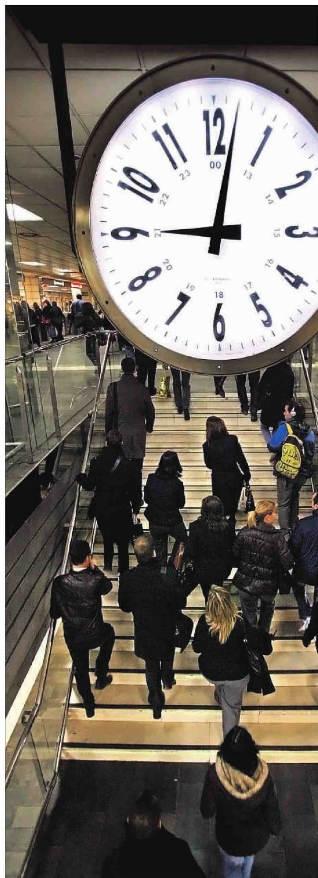
Estación de Renfe en Barcelona