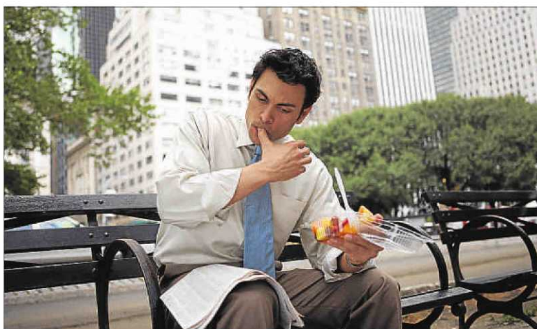
Almuerzo laboral en Nueva York, mientras en España el parón del mediodía alarga la jornada

Los promotores han hablado con el conseller Homs, con las organizaciones empresariales, sindicales, comerciales, con los partidos políticos para empezar a actuar. Y consideran que el actual momento de cuestionamiento de todo –las relaciones con el resto de España, de la política, de los poderes económicos– propician un buen "momento cero" para impulsar un cambio real en Catalunya. Es una europeización de los horarios y se dan tres años. Si no lo logran, no se alargarán.●