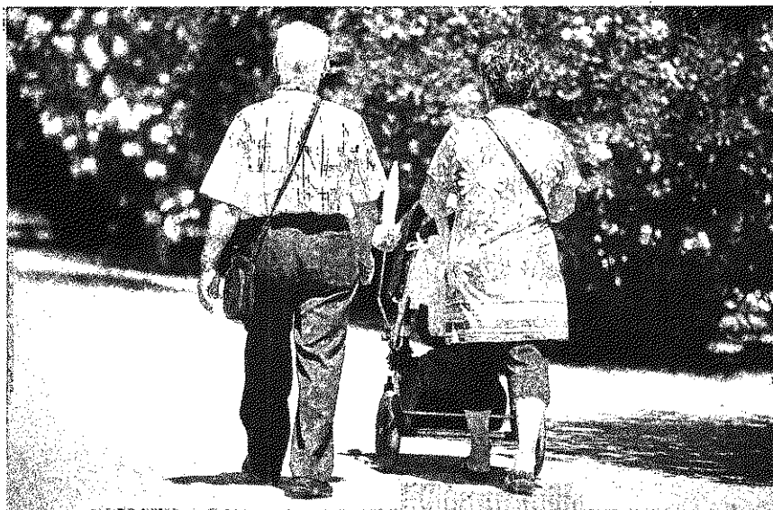
El régimen laboral de los padres obliga a muchos abuelos a hacerse cargo de sus nietos. HERALDO