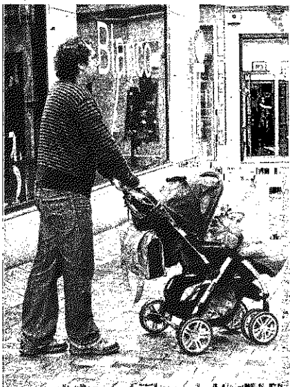
La conciliación es un objetivo para padres y madres. HA