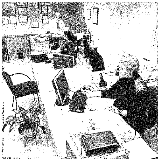
Yovoy Asesores ganó el Premio Empresa Joven Familiarmente Responsable. C. MUÑOZ

sibilidad de conciliación se le hace menos factible.