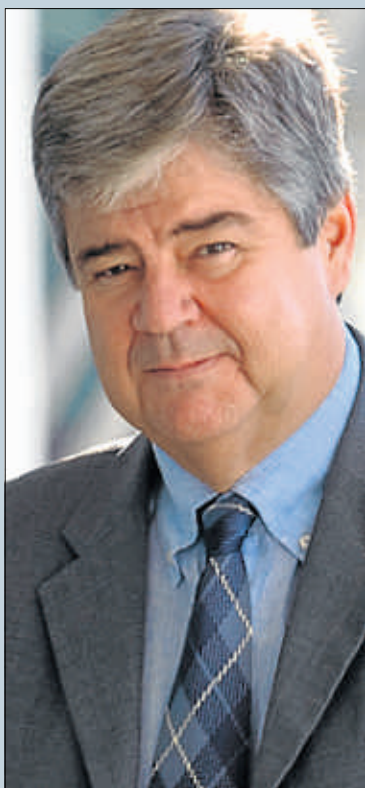
Guillem López Casasnovas Consejero del Banco de España

“Hay que seguir con los ajustes y la consolidación fiscal. La suavización en su caso ya la imponen a menudo circunstancias imprevistas; no veo adecuado un relajo adicional en sus actores principales. Para el impulso de la acción pública hace falta una capacidad de gestión del gasto y una competencia administrativa que desafortunadamente no tiene este país ni se ha preocupado en la época de bonanza de construirla. Los consensos entre agentes económicos y sociales son más fructíferos”.