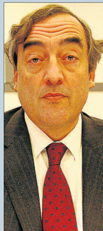
Juan Rosell Presidente de la CEOE

“Por encima de todo, lo que España tiene que hacer ahora es reducir el gasto público en todos los ámbitos: en el local, en el autonómico y en el estatal. Y mejorar la eficacia de la Administración simplificando las leyes y regulaciones. No creo que este año España termine en negativo, el crecimiento será reducido pero no negativo, porque el turismo y las exportaciones están evolucionando muy bien. Pero el recorte del déficit y las reformas son imprescindibles”.