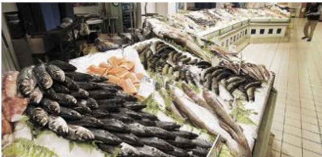
El mostrador de la pescadería de un centro comercial exhibe una gran variedad de pescados y productos del mar.

Los precios se han incrementado un 45% en España desde la entrada en vigor del euro en los mercados financieros en 1999, lo cual ha generado una gran pérdida de competitividad con respecto al resto de países europeos, según revela el informe Cesifo 2012 presentado hace unos días por la Fundación BBVA.